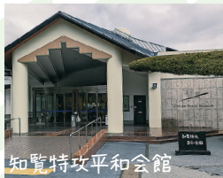
知覧特攻平和会館