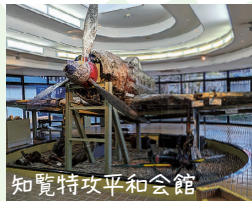
知覧特攻平和会館