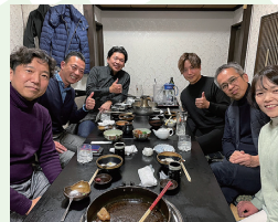
仲間とお酒の席もポジティブになれるアフターミーティングの一つかもしれません😊