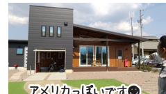
アメリカっぽい!です😊