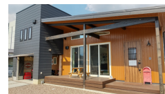
玄関横のお洒落なフロントポーチ♪