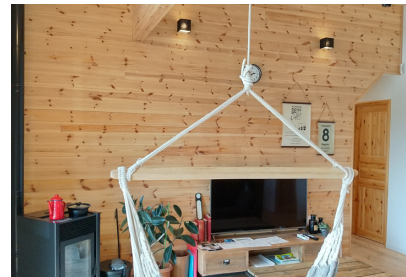
家のどこにいても(*´ω`*)木の香りに癒されます☆