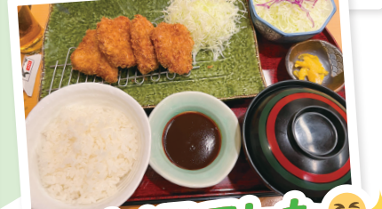
充実した1日でした😊✨