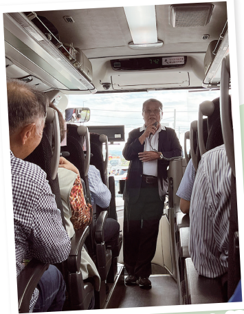
会長の挨拶からスタート👏