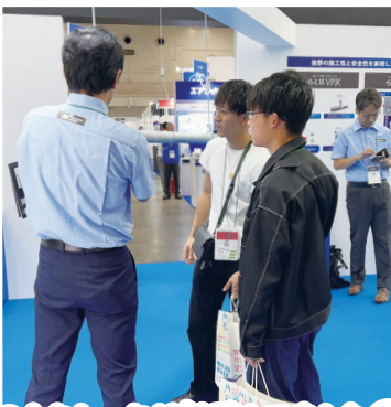
2人もしっかり勉強しました😊